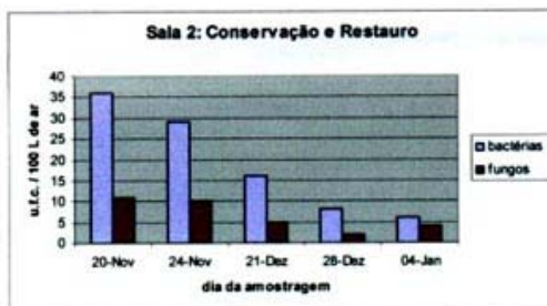
FIGURA 2. - Efeito do aparelhos na manutenção do nível de carga microbiana (bactérias e fungos) existente na sala 2 (Conservação e Restauro). No dia 24 de Novembro de 2000 foram ligados os aparelhos. Cada ponto representa a média de 3 contagens.

Pela observação das Figuras 1 e 2 verifica-se, que os aparelhos, reduziu o valor de ufc/100 L de ar, quer para bactérias, quer para fungos, embora o efeito foi mas acentuado no que diz respeito ao teor das bactérias.