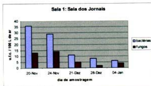
FIGURA 1. - Efeito dos aparelhos na manutenção do nível de carga microbiana (bactérias e fungos) existente na sala 1 (Sala dos Jornais). No dia 24 de Novembro de 2000 foram ligados os aparelhos. Cada ponto representa a média de 4 contagens.

Os resultados obtidos, quer para fungos, quer para bactérias, encontram-se apresentados nos gráficos das Figura 1 e 2 .